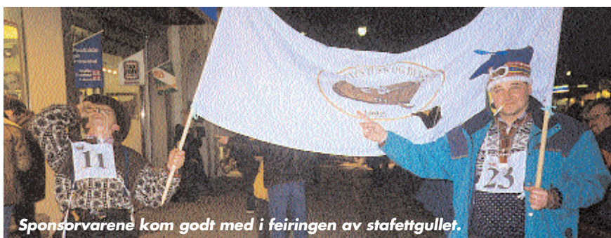
Sponsorene kom godt med i feiringen av stafettgullet.