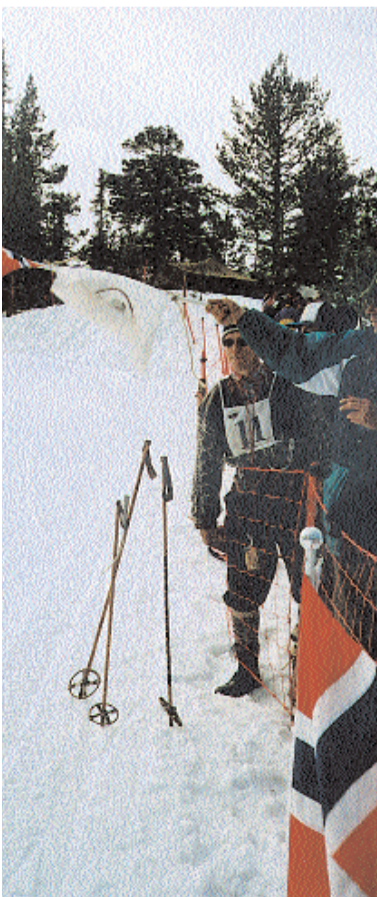
Stavstasjon langs løypa